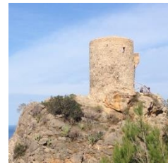
Torres de defensa