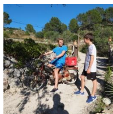
Historia de Mallorca