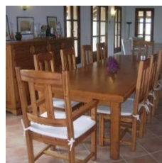
Alojamiento: Sala comedor